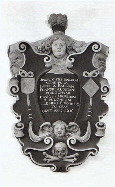
Grafmonument Joost Balbian.

Maar wanneer werd Balbian juist begraven en waar? De oud-archivaris van de hervormde gemeente van Gouda toonde aan de hand van het grafboek van de kerk en het kamerboek van Gouda aan dat de lezing van Muylwijk over zijn laattijdige begrafenis in de kerk onjuist is: Balbian kocht zijn graf begin 1616 en werd er op 8 mei 1616 begraven. Boven zijn graf werd aan de wand van het koor een vermoedelijk door Gregorius Cool gebeeldhouwd wandmonument aangebracht. Zijn grafschrift noemt hem een philochymus, wat vertaald kan worden als "vriend van de alchemie". In de Latijnse tekst van het epitaaf of grafschrift is een verwijzing opgenomen naar zijn liefde voor de alchemie. De vertaling van de tekst luidt: "Acht de dagen elk afzonderlijk als aparte levens. Van Joos Balbian, Vlaming uit Aalst, chemieliefhebber en van zijn erven. Hij gisteren, ik vandaag, gij morgen. Gestorven in 1616."