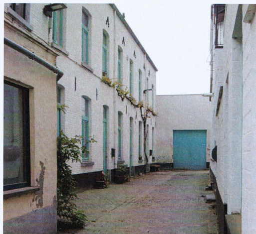
Ingang Levionnois (februari 2018).